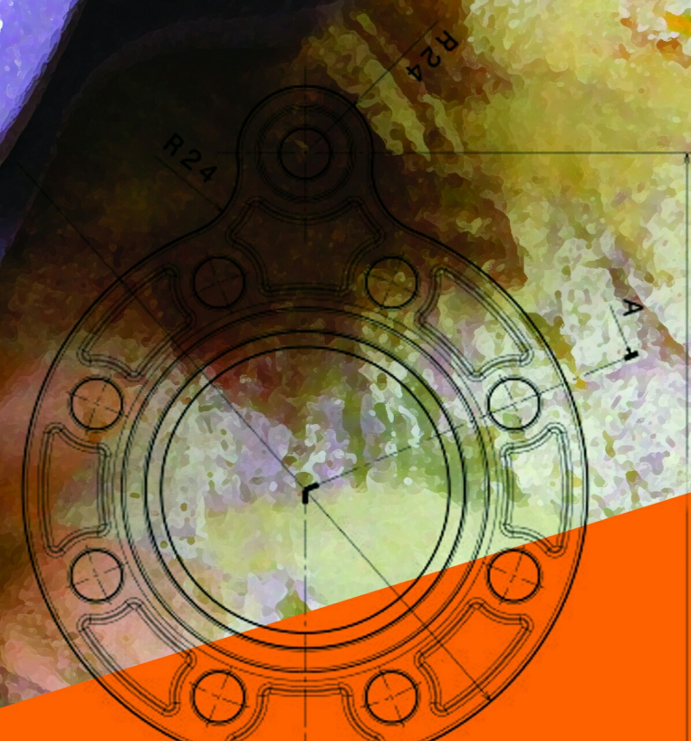
Front view Scale: 1:2